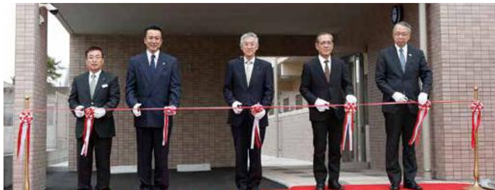
▲定住促進住宅 シヤルム文化通 落成式