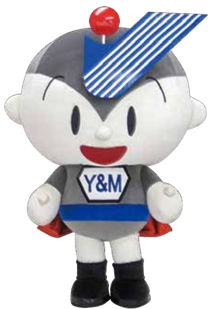
ユーミーマンション イメージキャラクター ユーミーマン