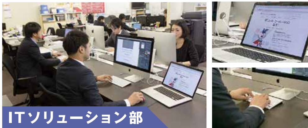
ITソリューション部

SV部は全国62社（2019年6月17日現在）のユーミーマンションFC加盟社に対しての支援業務（営業・建築・賃貸管理）を中心に、ユーミーマンションをご検討される全国のお施主様に対する「鹿児島施主視察」、全国加盟社を集めた「全国大会」などの様々なイベントの開催。その他、各種研修会・勉強会を開催し日本全国へフランチャイズ展開・推進しています。