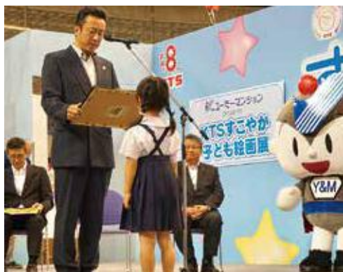
すこやかふれあいフェスティバル

今までにすこやかふれあいフェスティバルや映画試写会などの協賛イベントから完成見学会、納涼船、入居者イベントなど鹿児島はもちろん全国のイベントに参加しているユ♪最近SNSで繋がっているお友達も増えてきて、実際にそこから入居に繋がるという事例もあって嬉しいかぎりだユ♪これからも全国のみんなにもっともっと「ユーミーマンション」を広められるよう日々活動中していくユ♪